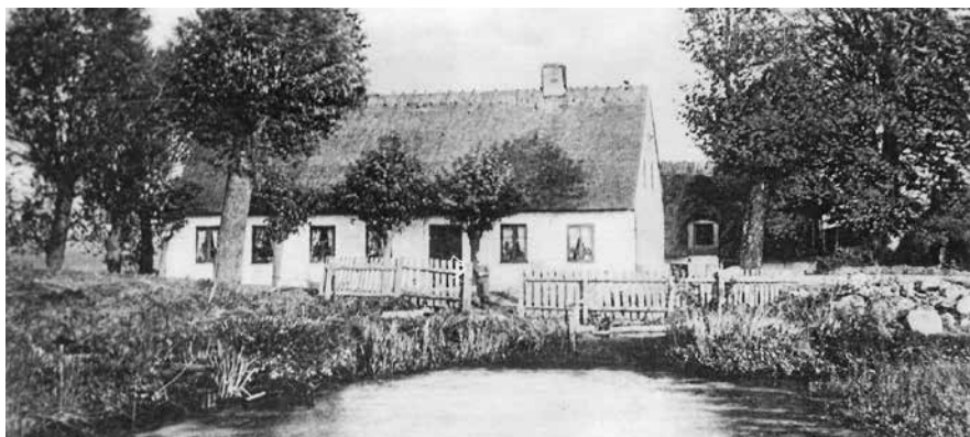
Elverdams Vandmølle. (Postkort, Tølløse Lokalkrav).