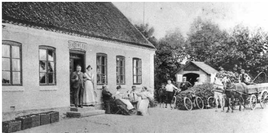
Gæster foran Elverdamskroen og formentlig kroparret i døren. (Postkort, Tølløse Lokalkaliv).