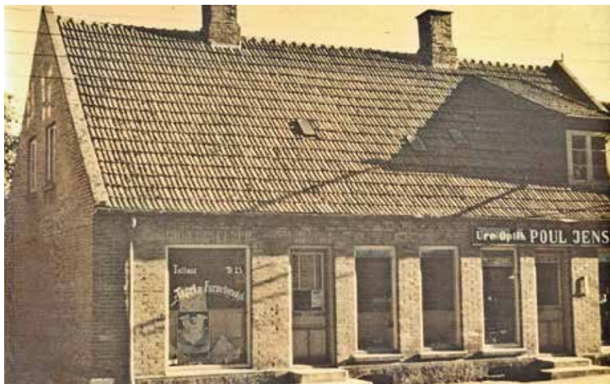
Af forretningsskiltet fremgår, at urmageren tilbød optik. Det var almindeligt, at urmagere lavede briller efter lægerecept.