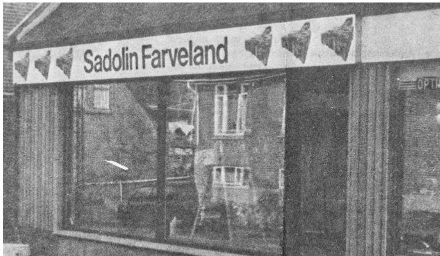
Ny facade med to store vinduer i 1977.

Farvehandlen havde fra 1967 til 1981 tre forskellige ejere, som på forskellige måder prøvede at tilpasse butikken til tidens handelsliv og konkurrence. Lokale prioriterin-