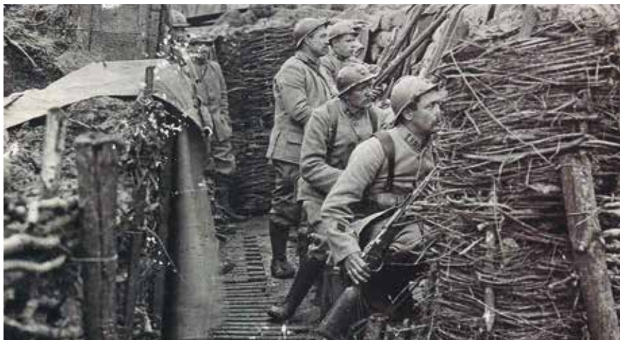
Franske soldater i skyttegravene ved Somme.