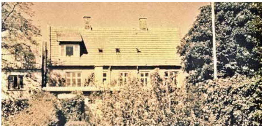
Røgeriets skorsten og tag anes i midten af billedet.